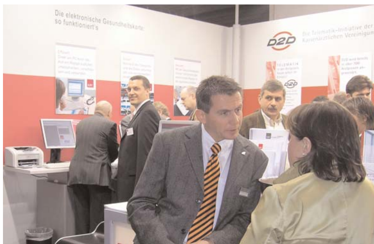
Die Kassenärztlichen Vereinigungen aus NRW und die KBV sind auf der Medica im November mit einem gemeinsamen Stand vertreten.

Was ich Ihnen schon immer einmal sagen wollte, Herr Kollege... Kommen Sie ins Gespräch: Mitglieder der Vorstände der KV Westfalen-Lippe und der KV-Nordrhein werden am 15. und am 18. November 2006 zwischen 14.00 und 15.00 Uhr am Messestand sein.