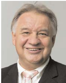
Kammerpräsident Dr. Windhorst befürwortet erneuten Protesttag in Berlin.

Ja, auch diese Beschlüsse der Koalition provozieren wieder Protest, und dies sicher nicht nur von den Vorständen der Krankenkassen. Auch für die Ärzteschaft werden mit dem Eckpunktepapier sicher nicht alle berechtigten Forderungen und Wünsche erfüllt. Insbesondere die Kolleginnen und Kollegen an den Kliniken werden schon bald deutlich spüren, wie ihre Häuser mit erneut heruntergeschraubten Budgets in die Knie gehen werden (siehe dazu auch das Editorial in diesem Heft). Für die niedergelassenen Kolleginnen und Kollegen steht es noch